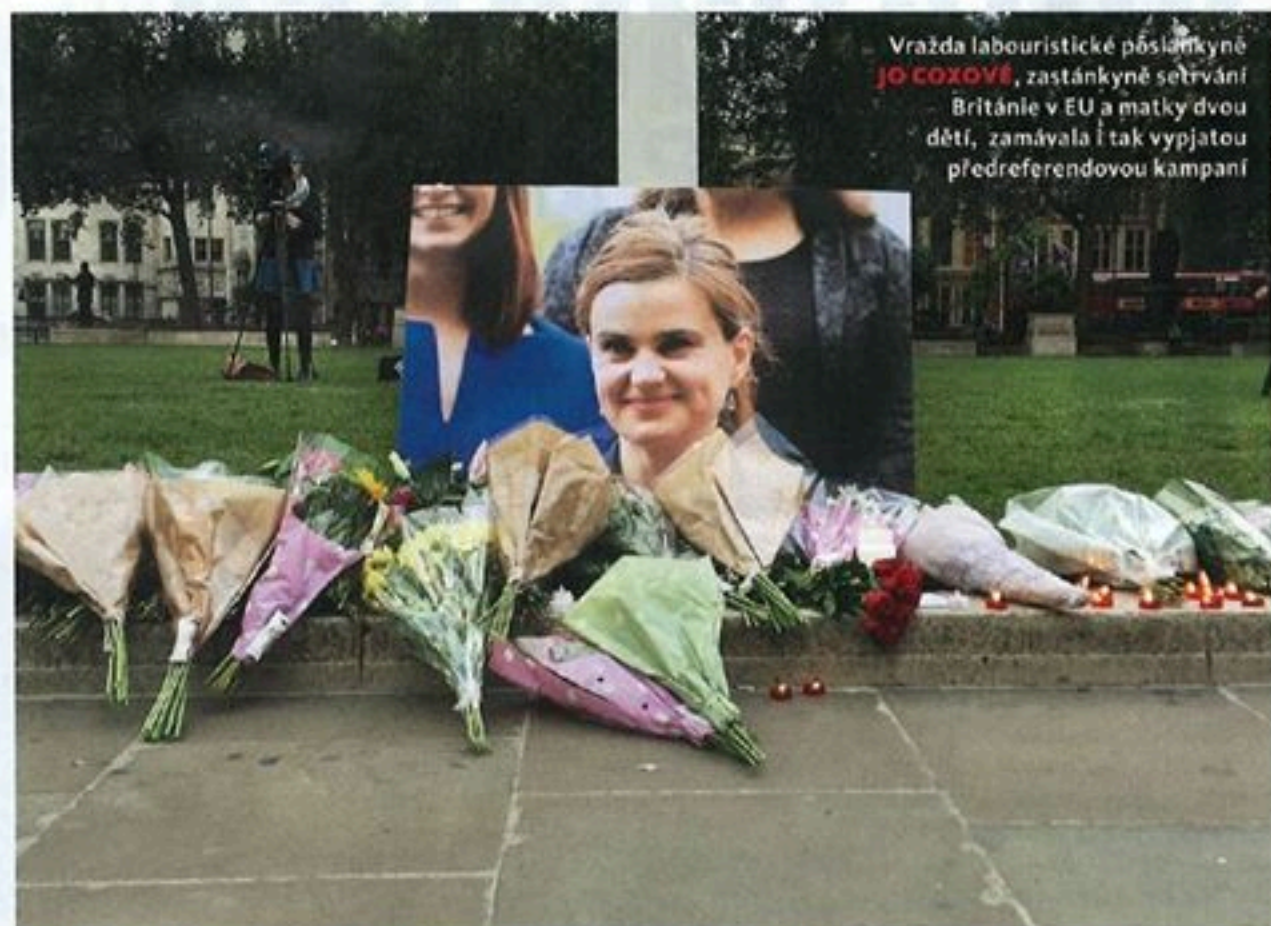
Vražda labouristické poslankyně JO COXOVÉ , zastánkyně setrvání Británie v EU a matky dvou dětí, zamávala i tak vypjatou předreferendovou kampaní

Opsáno z Twitteru od @BlanikZ: Pokud ANO vypoví koaliční smlouvu a zůstane ve vládě, bude se jednat o první úřednickou vládu přímo vzešlou z parlamentních voleb.